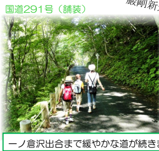
一ノ倉沢出合まで緩やかな道が続きます。